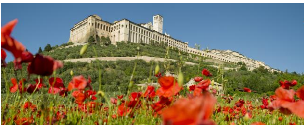
Basilica di San Francesco.

Vi skal bo midt i Assisi på et smukt og fredfyldt kloster med franciskanske brødre. Det er et unikt sted med eget køkken, hvor vi tilbereder vore måltider. Vi har hver vort værelse med toilet og bad.